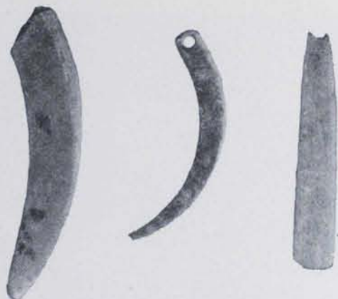
Fig. 39. — Cova de la Fou, Bor : Amulets de queixals de senglar (1:2 aproximadament)

Les restes prehistòriques recollides en la cova de la Fou, formen paral·lels en les altres coves excavades al Gironès, Ripollès i Garrotxa, com les de Rialp, Llorà, Sant Martí de Llémana, Serinyà, etc., essent no obstant molt més riques en materials de pedra i os, i la ceràmica un cop reconstruïda formarà una de les col·leccions més interessants de les coves excavades arreu de Catalunya. — JOSEP COLOMINES ROCA.